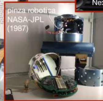
pinza robotica NASA-JPL (1987)