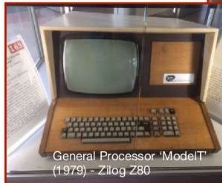
General Processor 'ModelT' (1979) - Zilog Z80