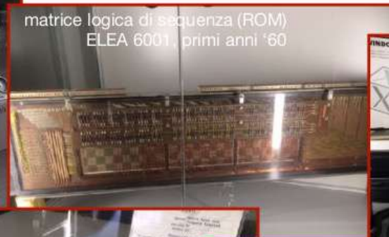
matrice logica di sequenza (ROM) ELEA 6001, primi anni '60