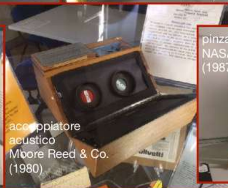
accoppiatore acustico Mbare Reed & Co. (1980)