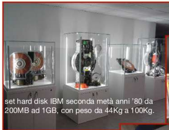
set hard disk IBM seconda metà anni '80 da 200MB ad 1GB, con peso da 44Kg a 100Kg.