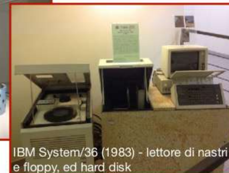
IBM System/36 (1983) - lettore di nastri e floppy, ed hard disk